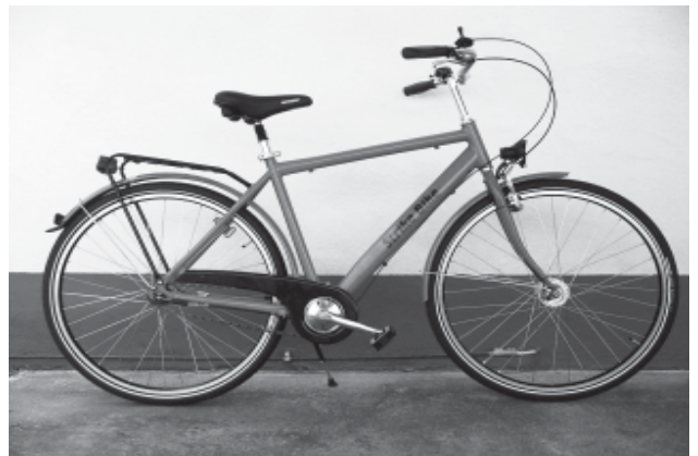
Strike.Bike / Herren

Die PolitikerInnen der bürgerlichen Parteien belassen es bei belanglosen Reden. Der eingesetzte Insolvenzverwalter äußerte bereits vor Erstellung seines Gutachtens, dass das Werk "geschlossen werden