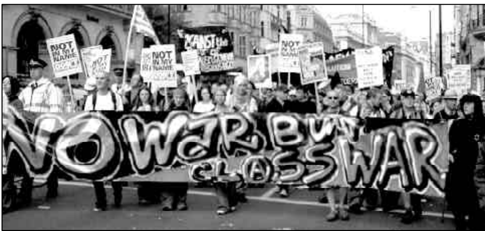
England: GegnerInnen der kapitalistischen Globalisierung fordern auf ihren Transparenten: „No War But Class War“

In Nicaragua unterhält die Firma Amanco eine Fabrik, in der ArbeiterInnen mit Asbest umgehen müssen. Der Firmenchef hielt es nicht für nötig, „seine“ ArbeiterInnen darüber aufzuklären, dass Asbest höchst krebserregend ist. Statt dessen wurden noch abgenutzte Förderbänder an die Arbeitenden verkauft, die sich daraus Klappbetten bauten. Nach 12 Stunden Arbeit in der Fabrik hatten sie nun das Asbest ca. 18 Stunden am Tag um sich. Von den ca. 600 Arbeitern leiden viele an starken Atemswegerkrankungen, 120 im Dorf bereits an Asbestose. Die ArbeiterInnen forderten angemessene Schutzkleidung, nachdem sie jahrelange nur mit T-Shirt und Hose bekleidet das Asbest bearbeiten mussten. Der Firmenchef bestritt einen Zusammenhang zwischen den Krankheiten und dem Asbest in seiner Fabrik. Die Arbeitenden forderten für ihre dahinsiechenden Kollegen eine medizinische Versorgung, die der Chef ablehnte. Stattdessen wurde