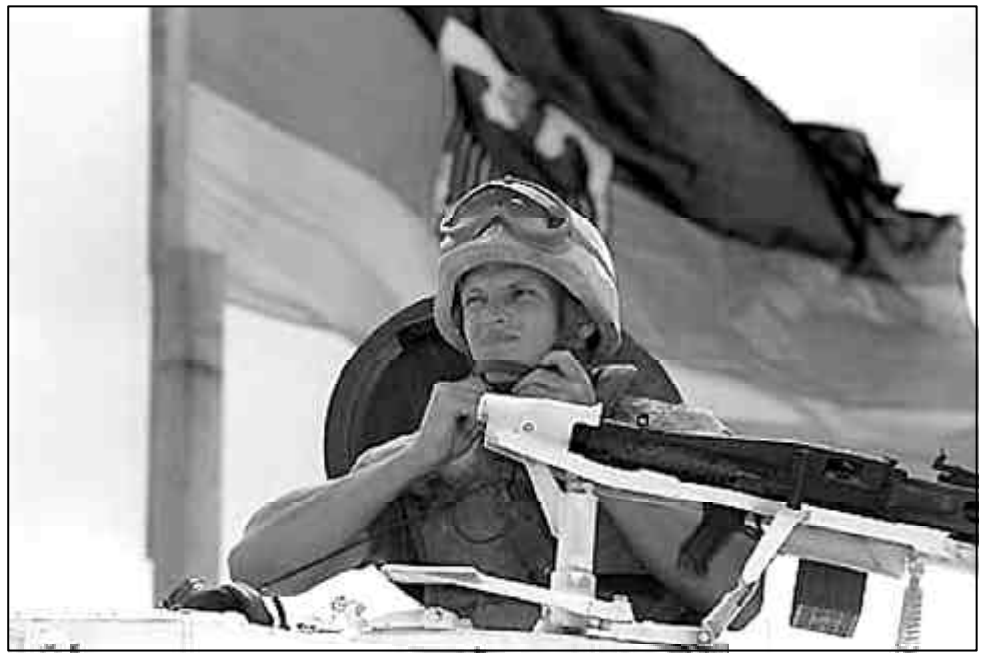
Auslandseinsätze der Bundeswehr: Ausdruck der imperialistischen Bestrebungen des deutschen Kapitals, aber ist dieses gefährlicher als französisches oder englisches?

Nationalismus und Islamismus in Bosnien sollen hier weder geleugnet noch beschönigt werden. Tatsache bleibt jedoch, dass großserbischer Nationalismus am Beginn der jugoslawischen Krise stand. Die brutale Unterdrückung im Kosovo gab das Startsignal für den Zerfall Jugoslawiens und war für den Ausbruch des Bürgerkrieges weit bedeutender als die frühere oder spätere Anerkennung dieser oder jener Teilrepublik durch diesen oder jenen imperialistischen Staat. Bosnien hat sich der ethnischen Polarisierung und dem Bürgerkrieg solange widersetzt, wie es irgend möglich war, und noch heute ist der aggressive völkische Nationalismus dort schwächer als in Kroatien oder Serbien, und auch der Islamismus wird nur von einer Minderheit vertreten.