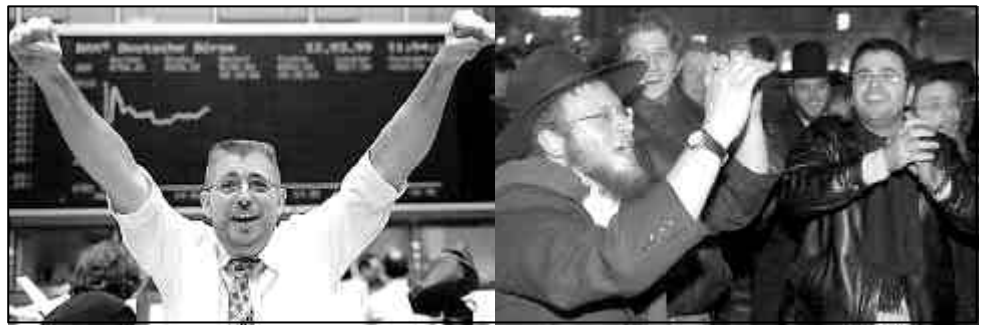
Antisemitismus: Zum Beispiel KapitalistInnen sagen und Jüdinnen und Juden meinen. Aber ist eine Klassenanalyse des Kapitalismus generell antisemitisch?

Tatsächlich sprechen Antisemiten oft davon, dass hinter dem Finanzkapital das