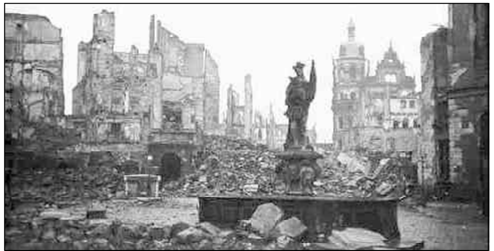
Dresden nach dem Bombenangriff 1945: Wollten die Alliierten nur möglichst viele Nazis töten?

Revolutionäre Politik weist die völkische