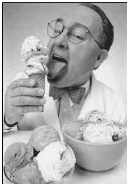
Nicht nur Eiskugeln können verschmelzen: Seit ca. 1900 zeigt sich die monopolistische Tendenz des Kapitalismus in einer neuen Qualität

Lenin belegt in seinem Werk „Imperialismus als höchstes Stadium des Kapitalismus“, dass seit ca. 1900 der Kapitalismus in ein neues Stadium, weg vom Kapitalismus der freien Konkurrenz, hin zum mo-