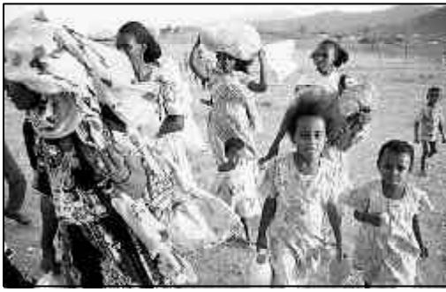
Unterentwickelt gehaltene Länder: Die „Zivilisation“ der „Festung Europa“ geht auf ihre Kosten.

Faktenlage alle gleichermaßen am Kapitalismus beteiligt wären, ist unverständlich. Natürlich ist die Trennung zwischen Kapital und Arbeit nicht klar erkennbar, weil es viele Zwischenschichten gibt. Die Grenzen sind also fließend. Das war in Klassengesellschaften schon immer so. Das macht die Zuordnung im Einzelfall vielleicht schwierig und die Realität unübersichtlich. Aber dies ist kein Argument gegen die Klassengesellschaft. Der individuelle Anteil am kapitalistischen Verwertungsprozess ist verschieden groß, niemand kann sich ihm voll und ganz entziehen. Entscheidend ist allerdings, was jemand tut. Ob mensch zu dieser oder jener Klasse gehört, hängt von der Stellung im gesellschaftlichen Produktionsprozess ab.