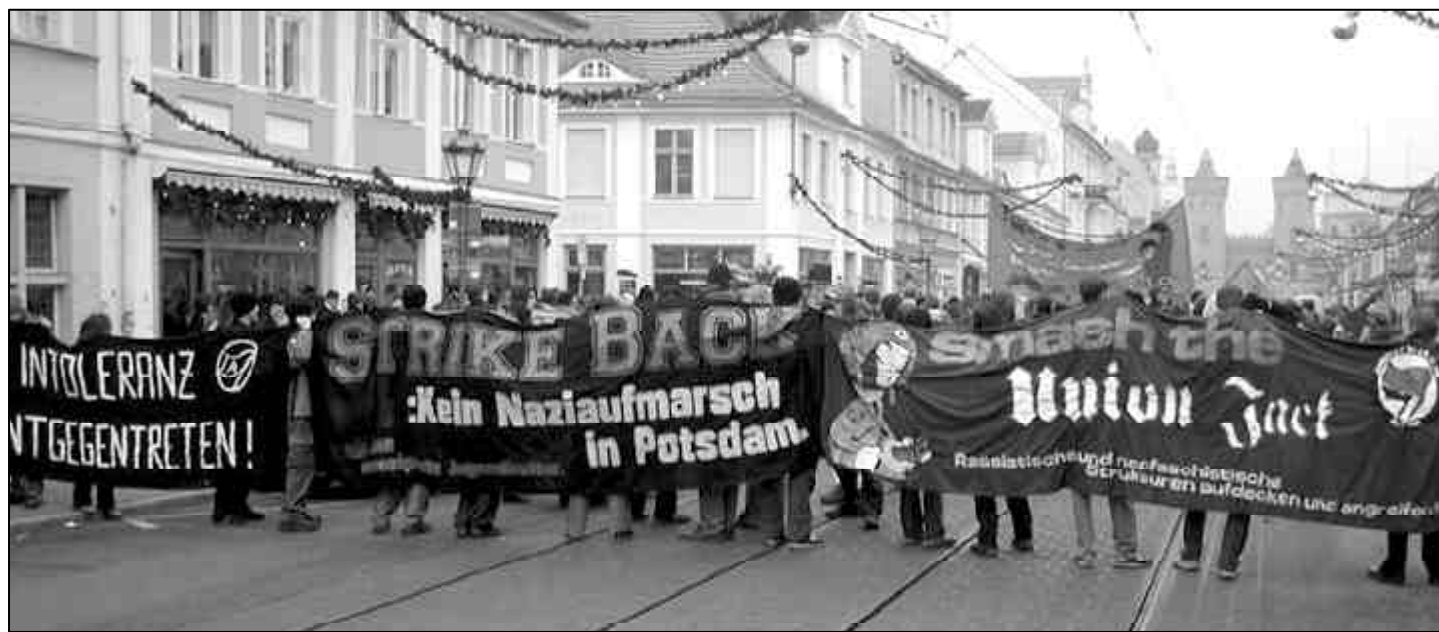
Potsdam: Anti-Nazi-Demo im Dezember 2002