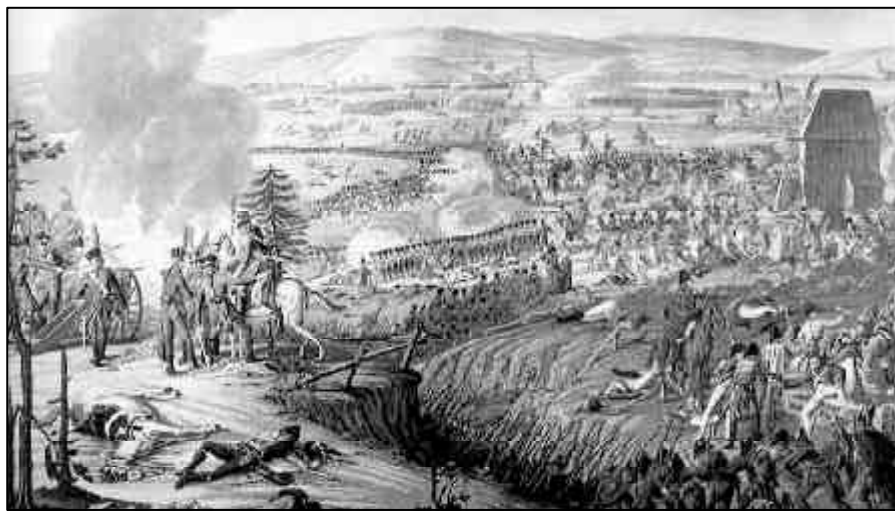
Schlacht bei Jena 1806: Napoleons Heere fegen über Europa hinweg.

Und auch das völkische Prinzip, das die Nationalität als Abstammungsgemeinschaft mythologisiert, taucht selbst in klassischen verfassungspatriotischen Staaten wie Frankreich auf. Dort wird das „Blutrecht“ nicht nur von Le Pens „Front National“ ver-