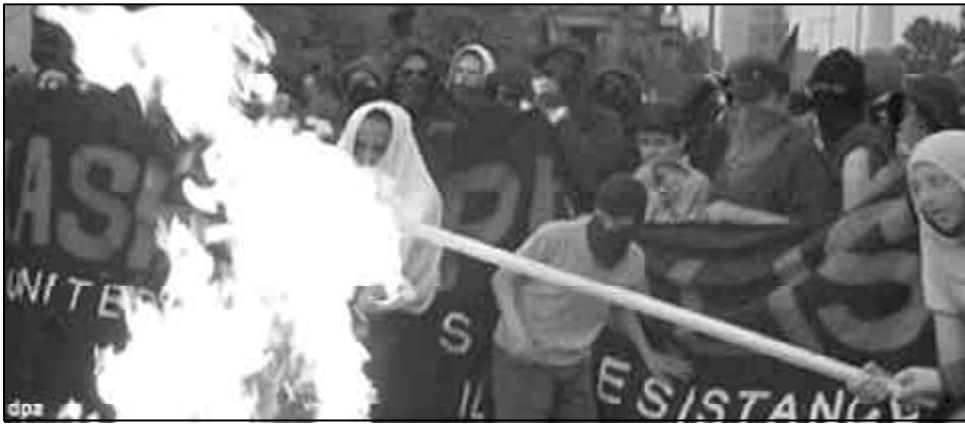
Rassismus oder subversive Aktion? Verbrennung einer Flagge.

kriegsbewegung findet sich ein wahrer Kern. Tatsächlich ist es zu kritisieren, wenn auf solchen Demos US-Flaggen verbrannt werden und die Alleinschuld an Krieg und Zerstörung dem amerikanischen Präsidenten Bush gegeben wird. Zu begreifen, dass Bush, Blair, Schröder und Co. nur Charaktermasken sind, hinter denen sich die jeweiligen nationalen imperialistischen Interessen verbergen, darin liegt jede Menge sozialer Zündstoff. Sowohl eine Personifizierung des Bösen als auch die bloße Kritik daran, die nicht versucht aufzuklären und die wirklichen Verhältnisse vom Kopf auf die Füße stellt, hilft uns im Verständnis nicht weiter, welche Interessen die imperialistischen Staaten antreiben. Nur einige PolitikerInnen, nicht die gesamte Kapitalistenklasse verantwortlich zu machen, schürt vor allem Illusionen in das herrschende System, das ja nach gewissen Gesetzmäßigkeiten funktioniert, die mensch nicht einfach wegreformieren kann. Aber in die Bewegung zu gehen und darin für den revolutionären Standpunkt zu werben, das aber gelingt den „Antideutschen“ nicht. Abseits steht es sich bequemer.