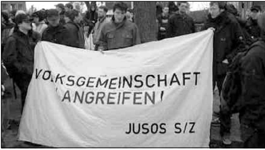
„Volksgemeinschaft“: Das Denken in diesen Kategorien ist auch in Teilen der deutschen Linken nichts unbekanntes.

fochten, sondern auch von renommierten bürgerlichen Politikern wie Chirac. Und auch ohne „Blutrecht“ weiß der rassistische Teil der weißen Bevölkerung recht genau, warum ein Staatsbürger nordafrikanischer Herkunft kein „echter Franzose“ sein kann.