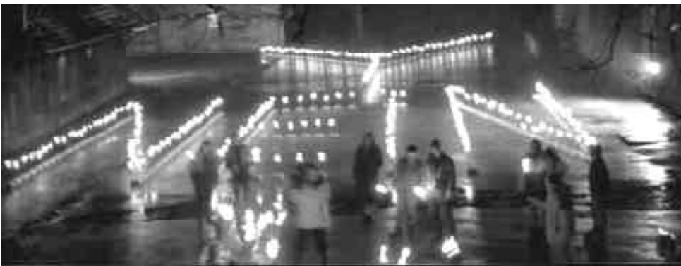
Lichterketten-Bewegung: Ausdruck des „deutschen Volkswillens“, sich in eine „rassistische Volksgemeinschaft“ einzugliedern?

In militärischer Hinsicht schließlich bleibt die BRD auf die EU-Partner angewiesen, denn nur in enger Zusammenarbeit können die europäischen Staaten eine eigenständige Rüstungsindustrie in Konkurrenz zu den USA erhalten. Die BRD ist keine Atommacht, und die Bundeswehr verfügt auch nicht über jenes Netz von Stützpunkten und Transportsystemen, das die USA, Großbritannien und Frankreich in Jahrzehnten aufgebaut haben und das Auslandseinsätze erst ermöglicht. Ohne die Hilfe der NATO hätte die Bundeswehr im