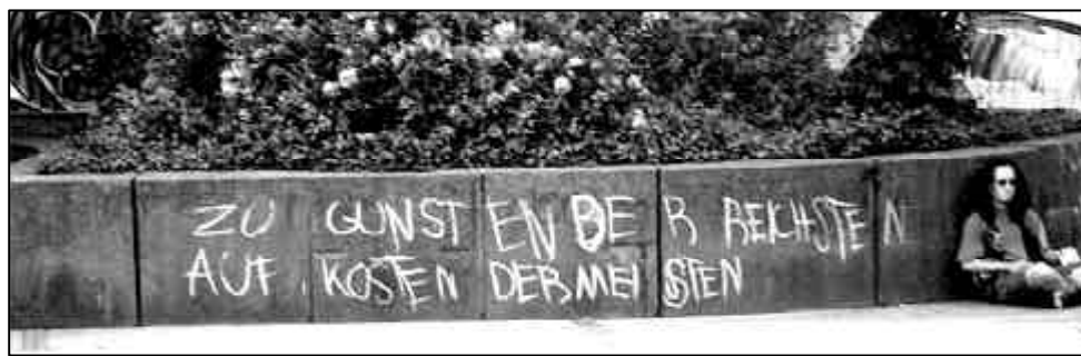
Weise Worte: „Zu Gunsten der Reichsten - auf Kosten der Meisten.“

JedeR linke GewerkschafterIn, jedeR Linke, der/die es wagt, gegen die ungerechten Verhältnisse im Betrieb, in der Schule, in der Uni aufzustehen und sich nicht als „antideutscheN“ Ideologen/-in versteht, wird damit zum Antisemiten abgestempelt.